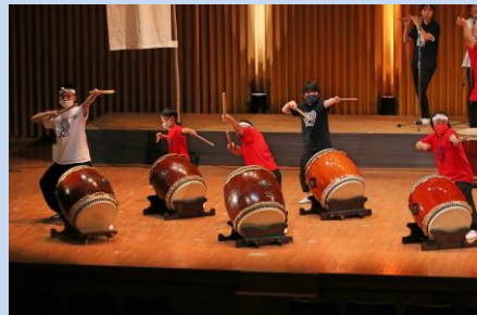
③「 走 楽(らん)」〈斜め打ち〉★★★

【練習会日程】以下の予定ですが、2回目以降の練習時間割は、追ってのご連絡となります。