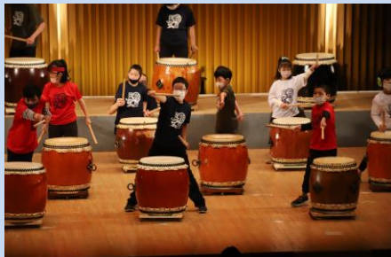
②「 太 鼓 で わっしょい」★★