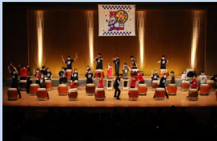
①「 ど ん ど んばやし」★